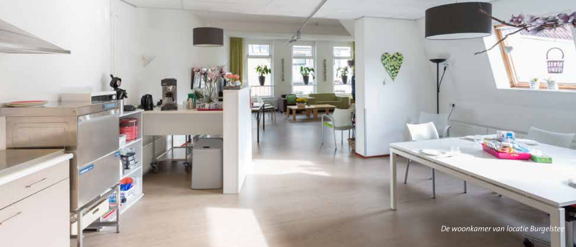
De woonkamer van locatie Burgelstee