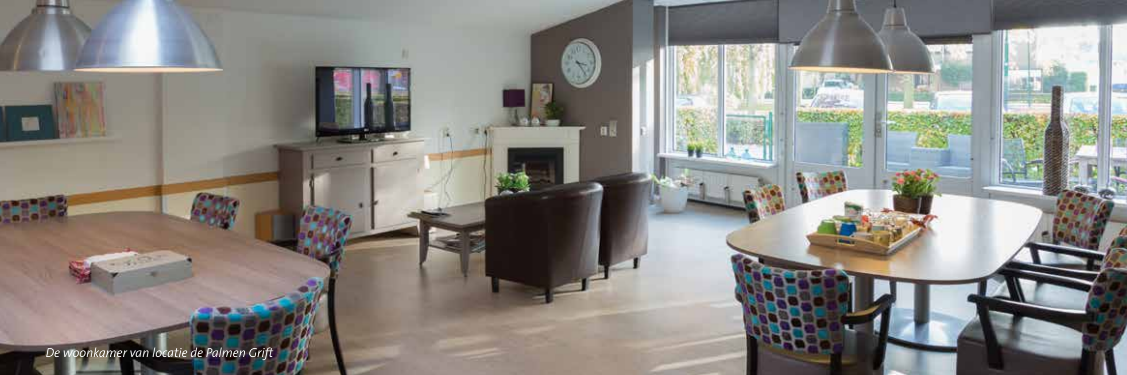
De woonkamer van locatie de Palmen Grift