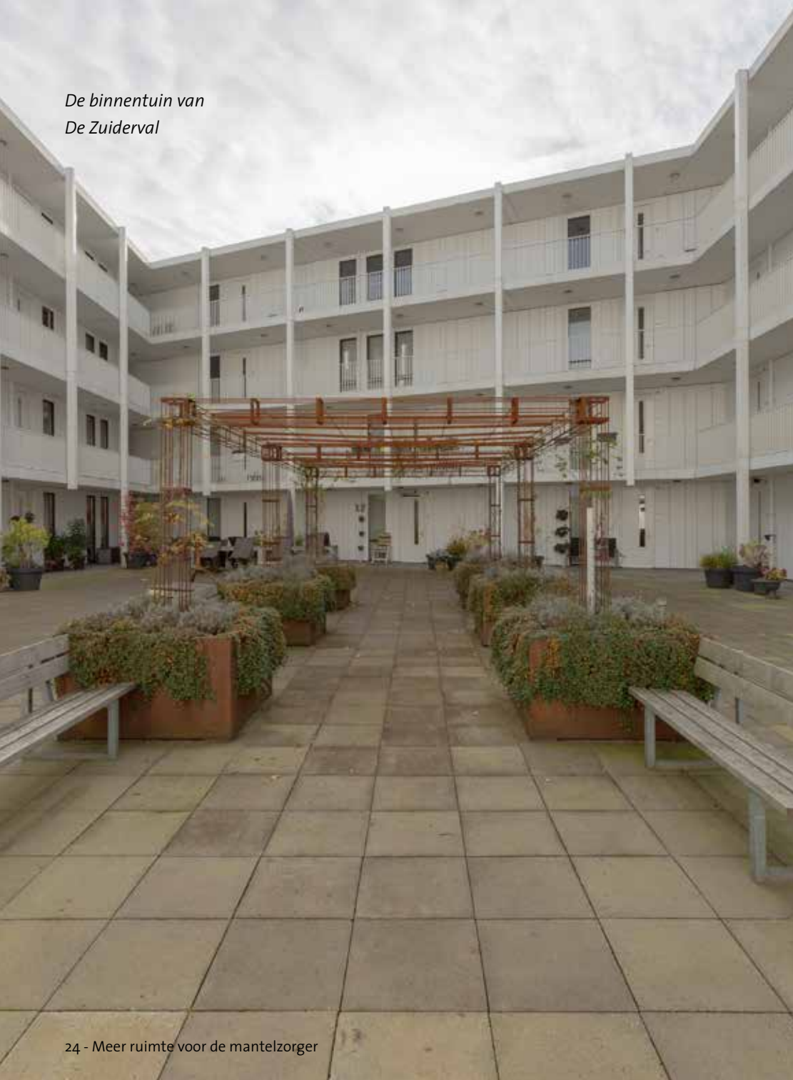
De binnentuin van De Zuiderval